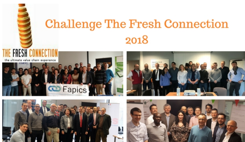
Préparation du Challenge lors des journées découverte à la DGE à Paris, à l'ECAM Lyon, à Euralogistic, le pôle d'Excellence en Logistique & Supply Chain des Hauts de France et lors d'une soirée avec le groupe professionnel Achat et Supply Chain de Centrale Supélec.

Pour cette édition 2018 on note une évolution en ce sens puisque 9 équipes sur 10 sont mixtes . Une tendance qui, on l'espère, traduit une évolution des pratiques en matière de recrutement pour les entreprises qui veulent gagner en performance.